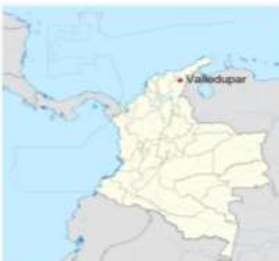
Figura 1. Localización Municipio de Valledupar - Cesar.