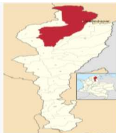
Figura 2. Localización de Valledupar en el Departamento Cesar (Fuente).

El municipio de Valledupar priorizó en su zona corregimental 13 corregimientos de los cuales 6 son centros poblados urbanos y 7 centros poblados rurales, 2 serán objeto de ejecución siempre y cuando el contratista seleccionado los haya ofertado, con el fin de obtener puntaje adicional.