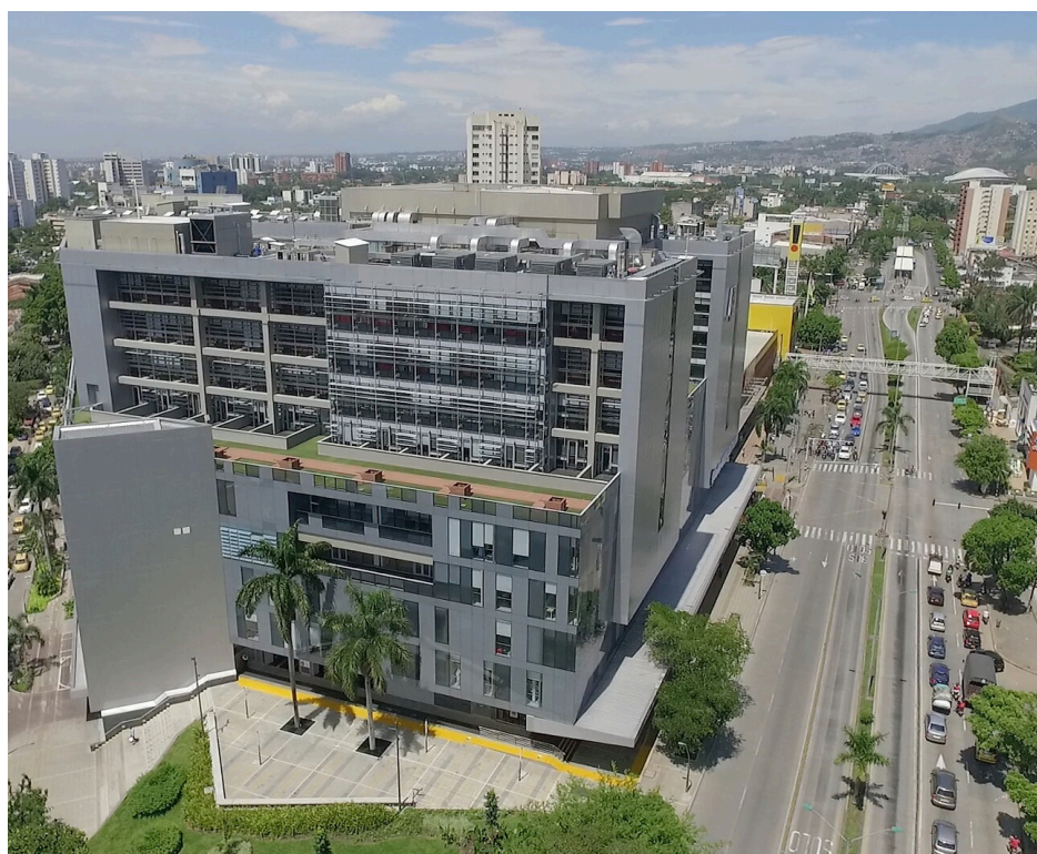
Clínica Imbanaco - Cali - Findeter

Siguiendo la idea de financiar proyectos de infraestructura y dotación hospitalaria, el Ministerio de Salud y Protección Social, a través de la Resolución 1107 del 11 de julio de 2023, asignó COP 113.767 millones para “financiar proyectos de infraestructura física y adquisición de equipos biomédicos de ESE de los departamentos de Boyacá, Cundinamarca, Guaviare y Santander” 7 . Algunos de los municipios que recibirán financiación del Gobierno nacional son Samacá y Soatá en Boyacá; Soacha, Facatativá y Mosquera, en Cundinamarca (11 en total); Miraflores en Guaviare; y Suaita y San Andrés en Santander. Vale la pena destacar que más de la mitad de los municipios son categoría 6. Entre los proyectos a financiar está la construcción del Hospital de Primer Nivel Albert Schweitzer en el municipio de Miraflores, Guaviare, con una inversión de COP 24.400 millones por parte del Gobierno nacional.