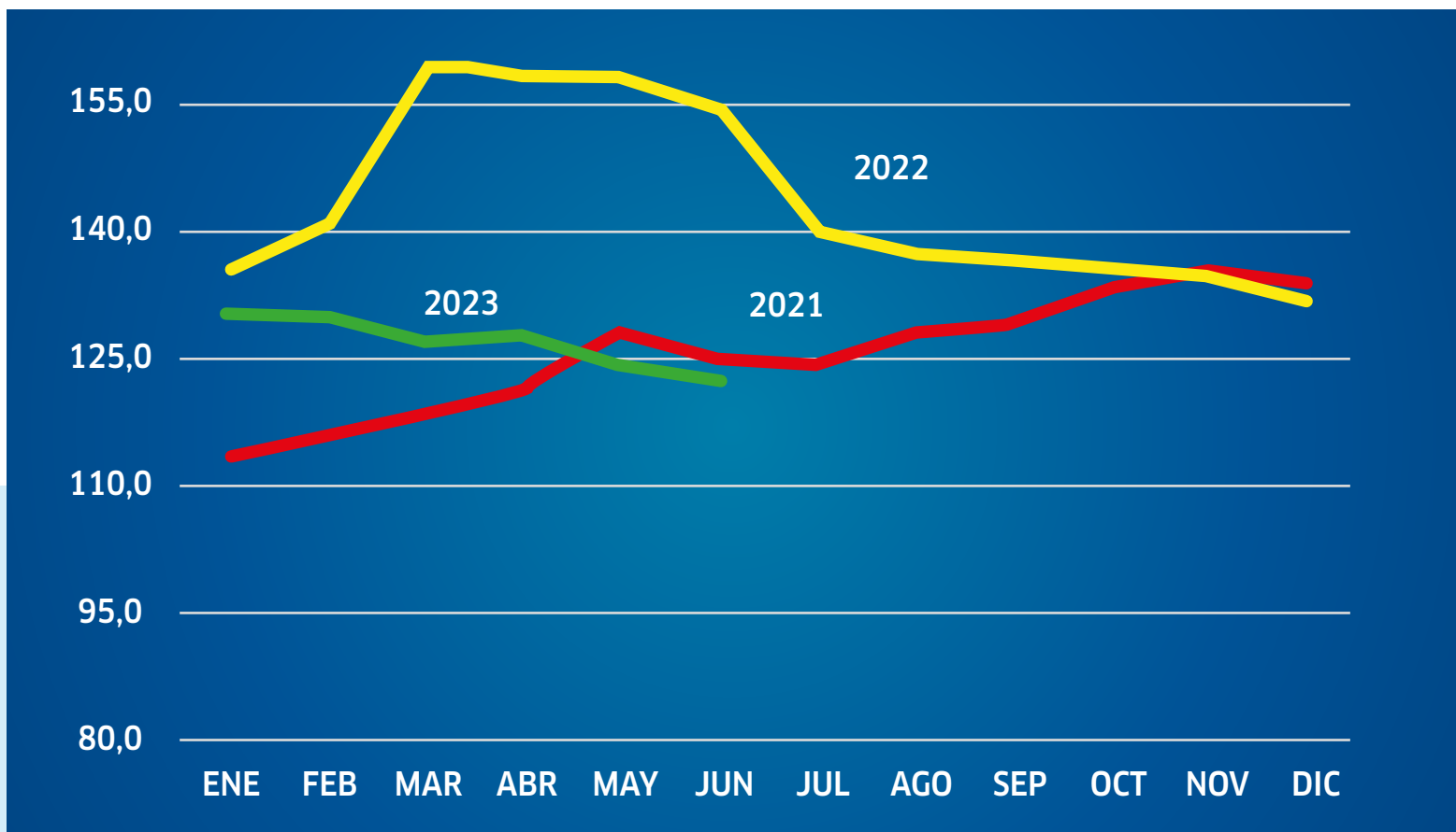
Gráfico 2. Evolución índice de la FAO para los precios de los alimentos (2021-2023)

El Índice de la FAO para los precios de los alimentos se construye a partir del promedio de los índices de los cinco grupos de productos básicos (carne, productos lácteos, cereales, aceites vegetales, y azúcar). Este índice ha ido disminuyendo de forma importante: en marzo de 2022 llegó a su valor más alto desde la irrupción del conflicto entre Ucrania y Rusia - 159,7, y en diciembre del mismo año este ya había bajado a 131,8, una disminución del 21,2%. La misma tendencia se ha presentado en 2023: en junio, el índice presentó un valor de 122,3, dato que es un 7,7% menor al exhibido en diciembre del año anterior (Gráfico 2).