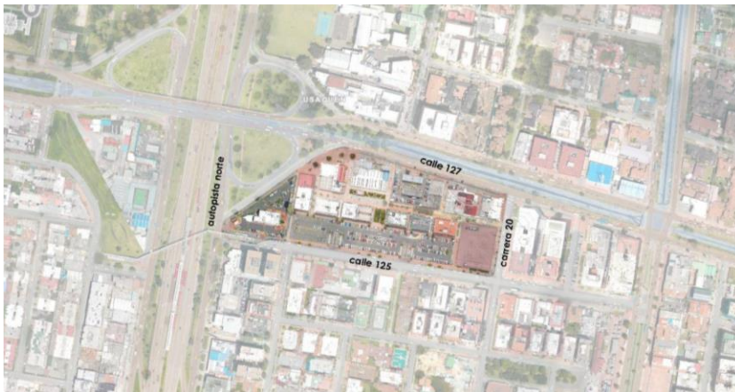
Figura No. 1- Ubicación Proyecto Calle 125

Localización.