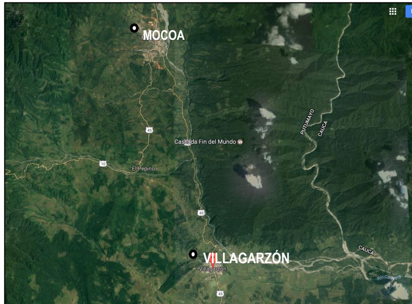
Figura 1. Localización Municipio de Mocoa – Putumayo

superficiales. Está ubicado en la parte alta de la cuenca del río Mocoa y el Río Cascabel, en estribaciones del Cerro Juanoy, su altura sobre el nivel del mar oscila entre 2.000 y 3.200 metros.