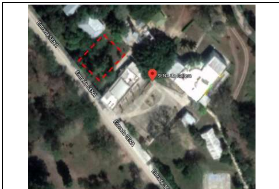
Fotografía 2. Ubicación específica del almacén en la Sede La Gallera.