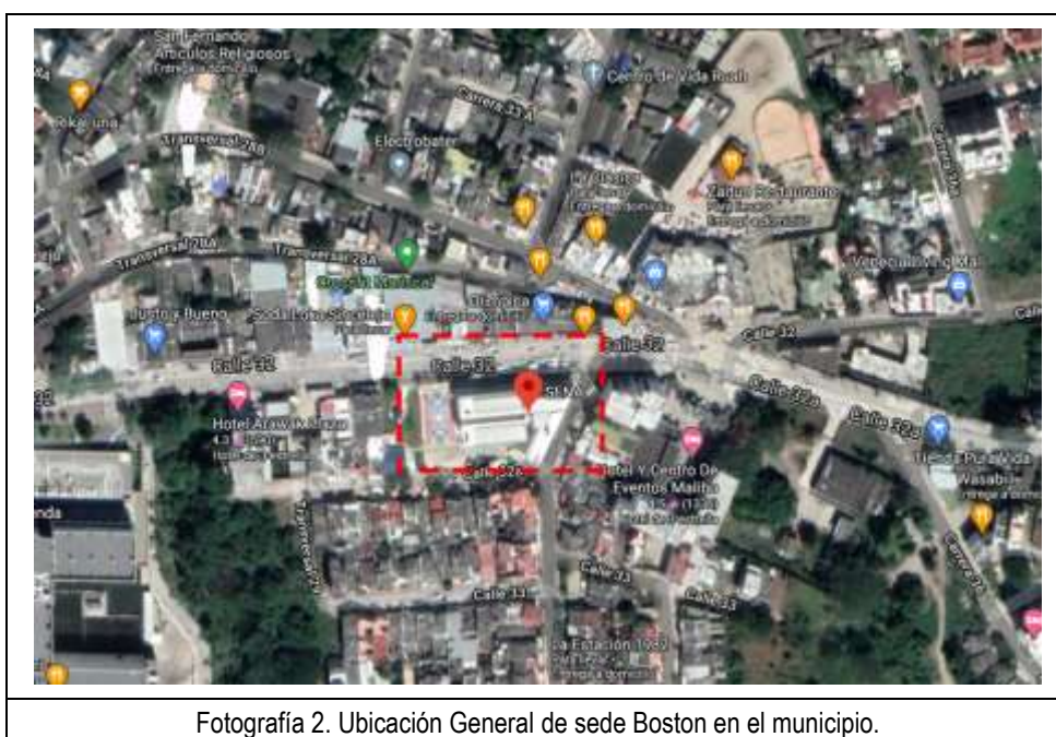
Fotografía 2. Ubicación General de sede Boston en el municipio.