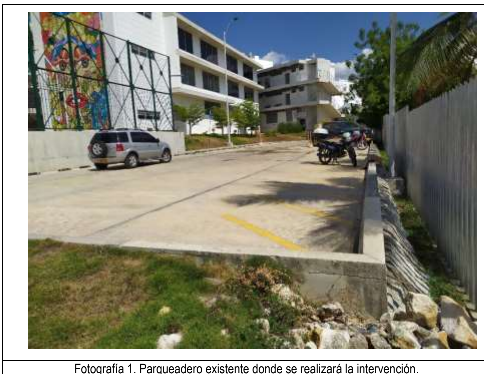
Fotografía 1. Parqueadero existente donde se realizará la intervención.

Ubicado en la dirección calle 25 B No. 31 – 260, Avenida Mariscal Sincelejo – Sucre, predio bajo título del SENA, identificado mediante Certificado de Tradición y Libertad con matrícula No. 340-20340 de 09 de mayo de 2013, según Escritura Pública No. 962 de 25 de noviembre de 1970 registrada en la Notaría 2° del Circulo de Sincelejo.