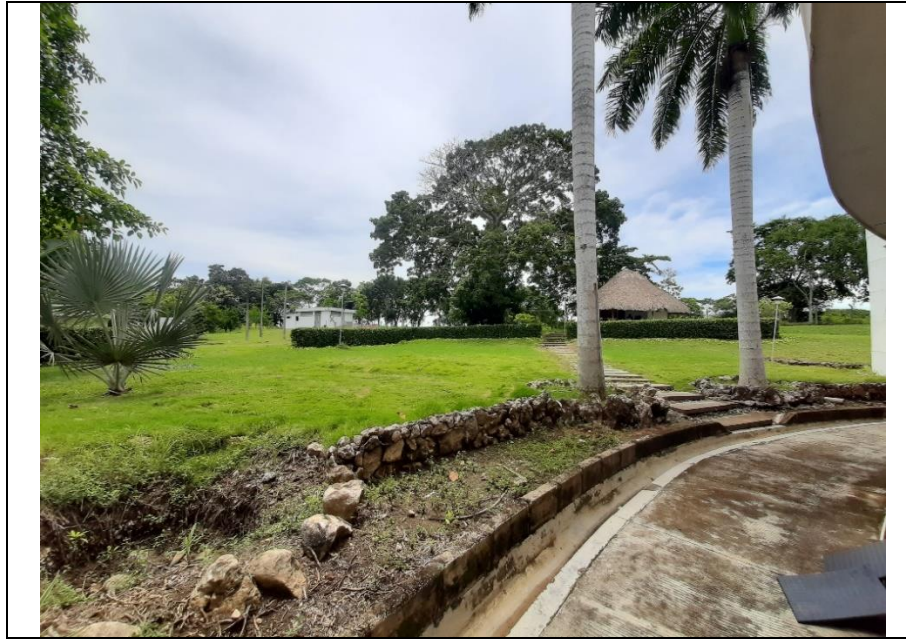
Fotografía 3. Predio disponible para biblioteca y archivo.