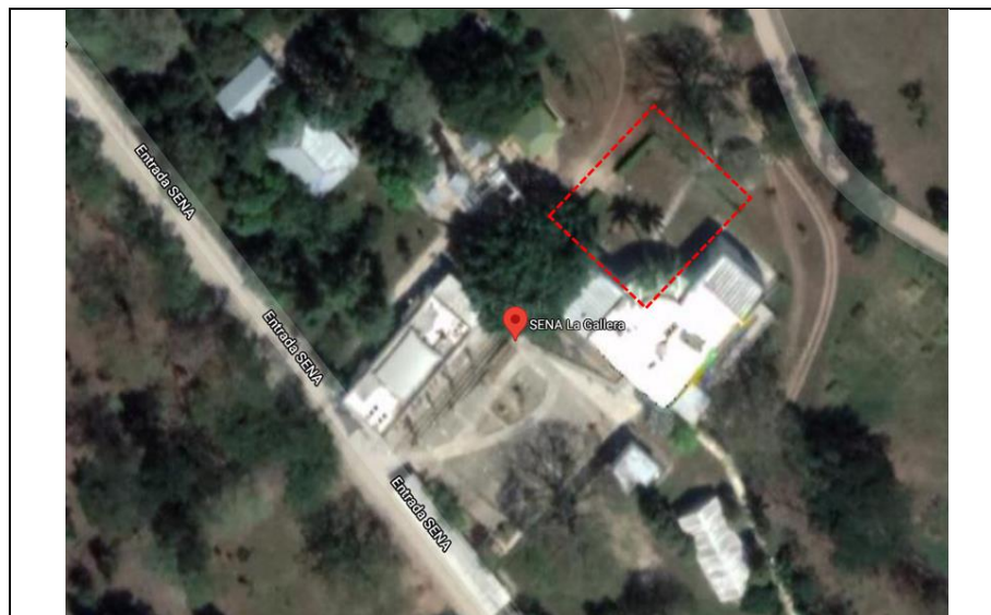
Fotografía 2. Ubicación proyectada de la biblioteca y archivo en la Sede La Gallera.