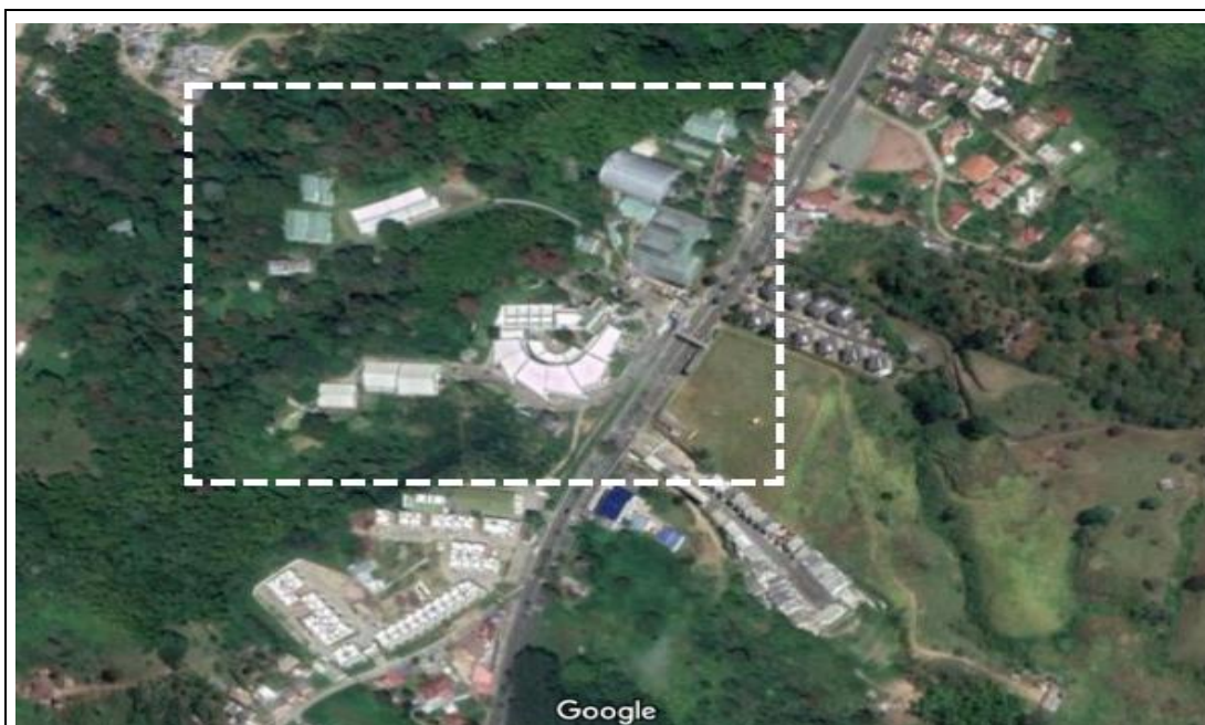
Fotografía 2. Ubicación específica Centro Agroindustrial Complejo la Sirenita