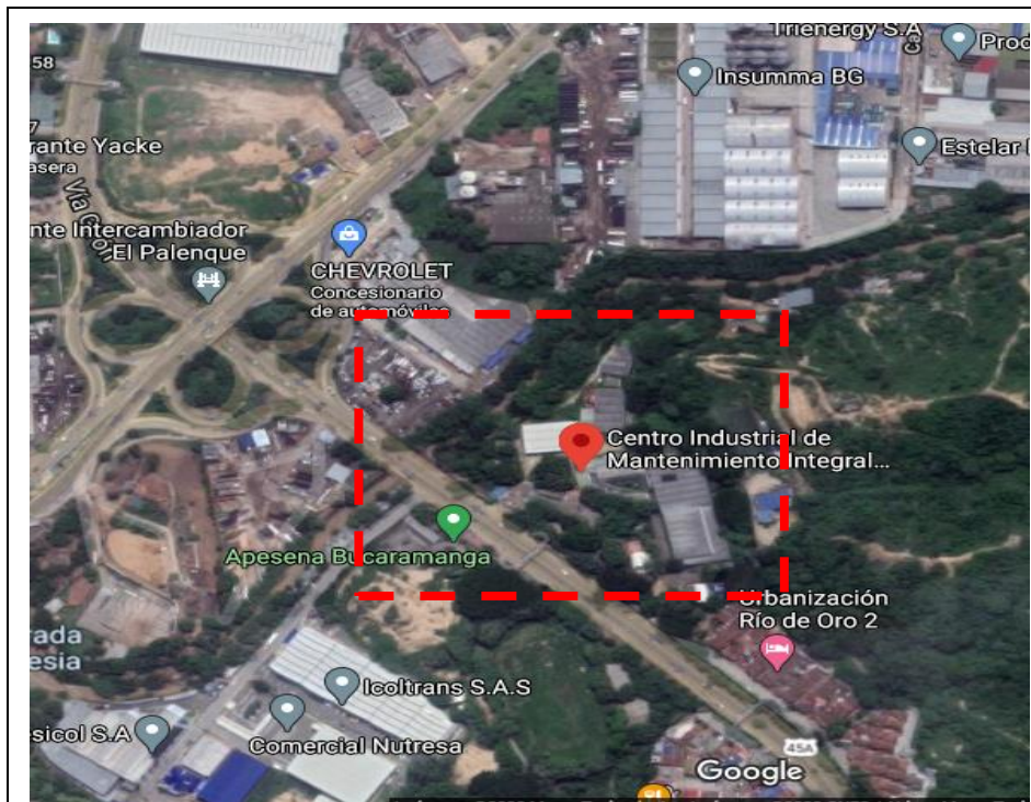
Fotografía 1. Ubicación General en la ciudad