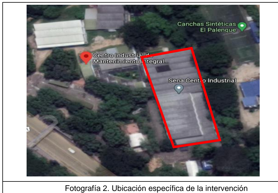
Fotografía 2. Ubicación específica de la intervención