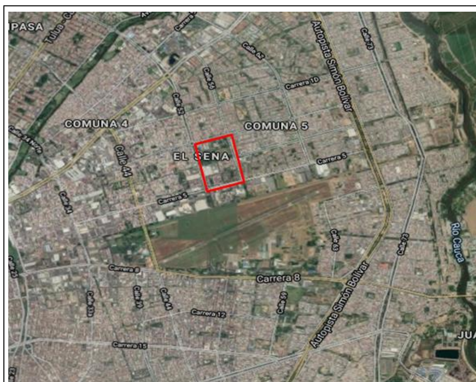
Fotografía 1. Ubicación General en la ciudad