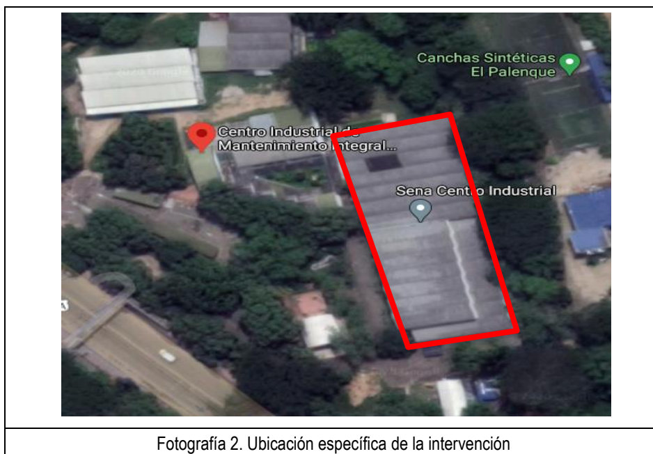
Fotografía 2. Ubicación específica de la intervención