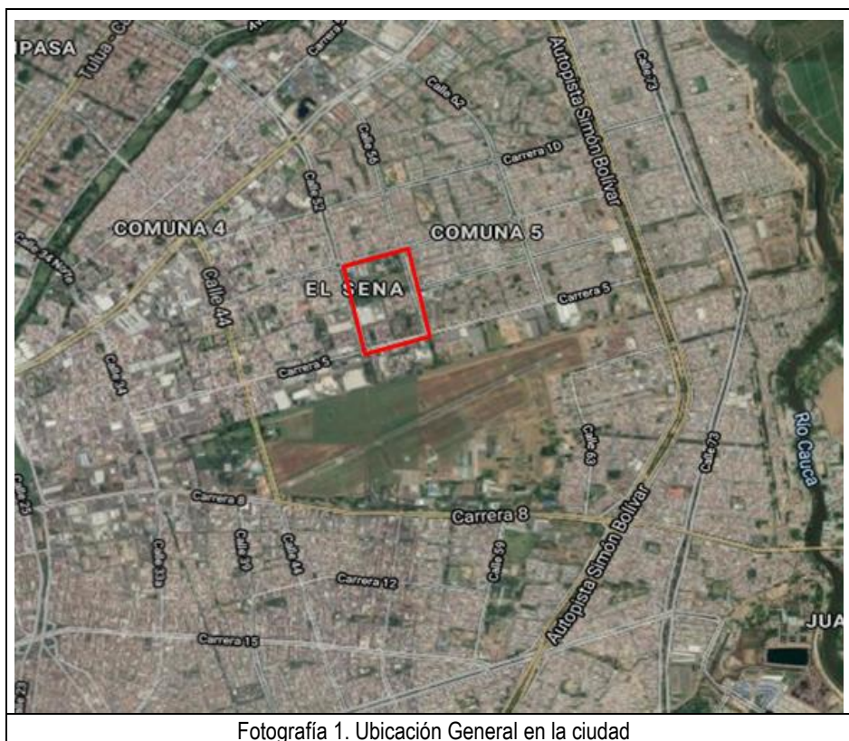
Fotografía 1. Ubicación General en la ciudad