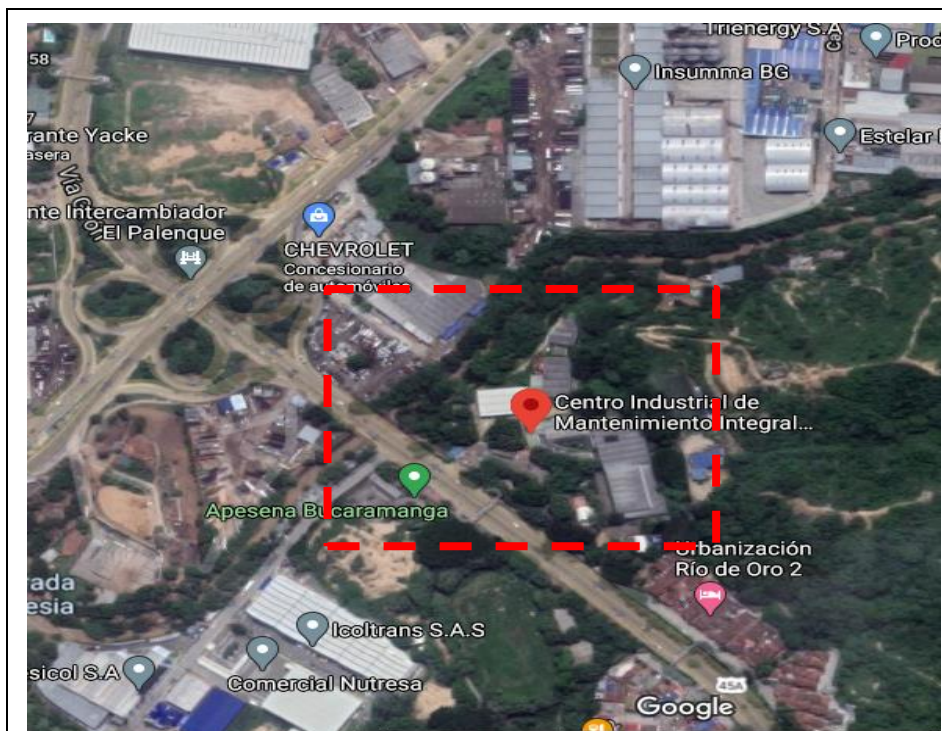
Fotografía 1. Ubicación General en la ciudad