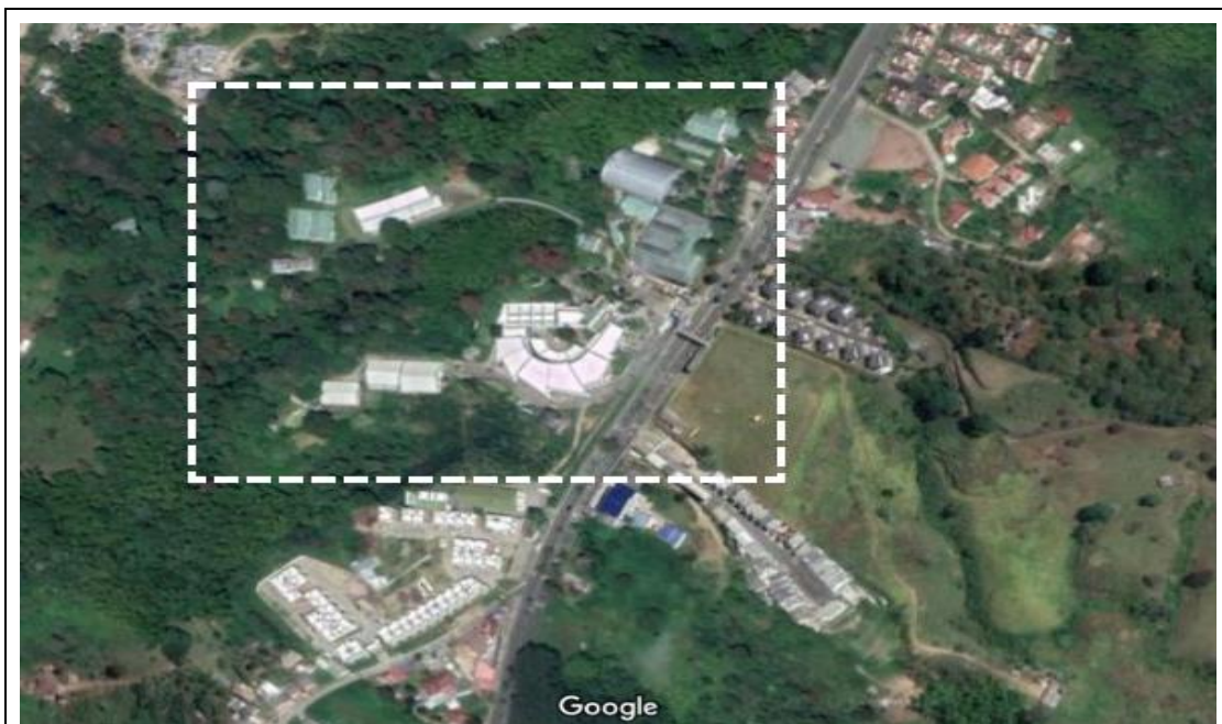
Fotografía 2. Ubicación específica Centro Agroindustrial Complejo la Sirenita