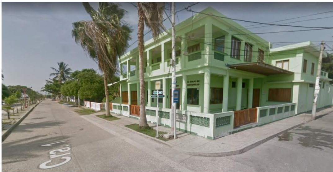
Fotografía 1. Ubicación de la Escuela De Gastronomía Y Turismo Del Golfo Del Morrosquillo.