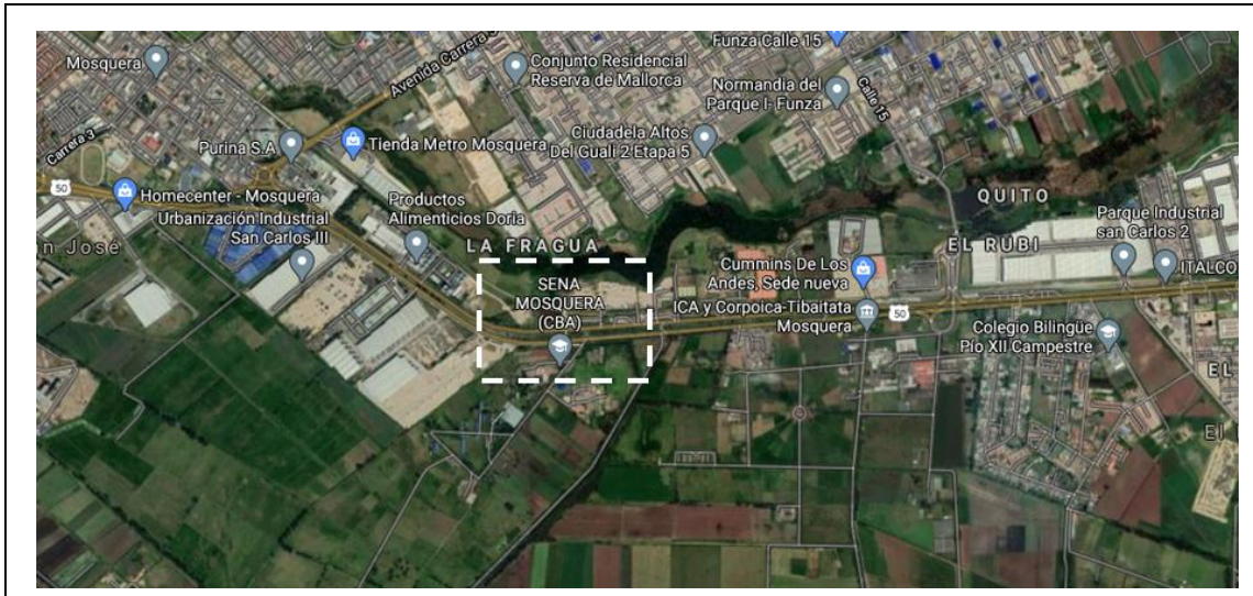
Fotografía 1. Ubicación General en la ciudad