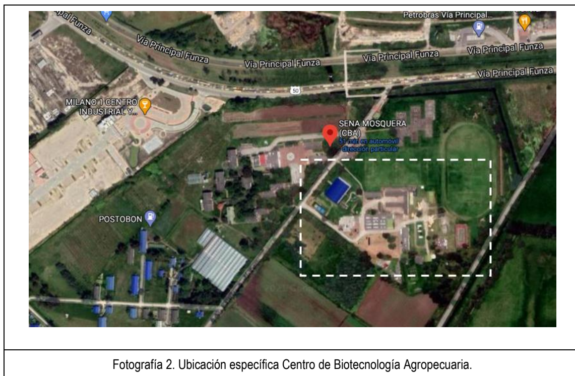
Fotografía 2. Ubicación específica Centro de Biotecnología Agropecuaria.