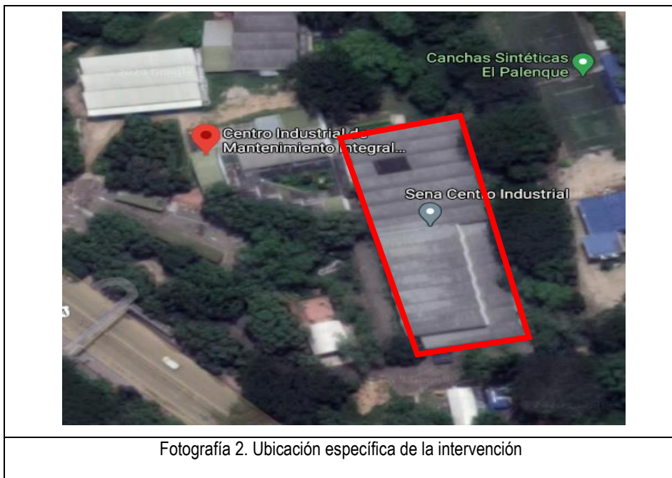
Fotografía 2. Ubicación específica de la intervención

NOTA: CONOCIMIENTO DEL SITIO DEL PROYECTO: Será responsabilidad del proponente conocer las condiciones del sitio de ejecución de los proyectos y actividades a ejecutar, para ello el proponente podrá hacer uso de los programas informáticos y las herramientas tecnológicas disponibles, teniendo como punto de referencia la ubicación de cada Centro de Formación. En consecuencia, correrá por cuenta y riesgo de los interesados, inspeccionar y examinar los lugares donde se ejecutarán los proyectos, los sitios aledaños y su entorno, e informarse acerca de la naturaleza del terreno, la forma, características, accesibilidad del sitio, disponibilidad de canteras o zonas de préstamo, así como la facilidad de suministro de materiales e insumos generales. De igual forma, la ubicación geográfica del sitio del proyecto, historial de comportamiento meteorológico de la zona y demás factores que pueden incidir en la correcta ejecución del proyecto.