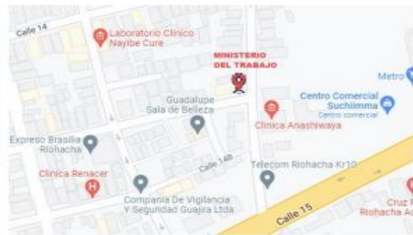
Dirección Territorial del Ministerio del Trabajo de La Guajira, Cra. 10 # 14- 102