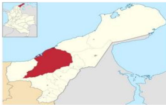
Riohacha, La Guajira