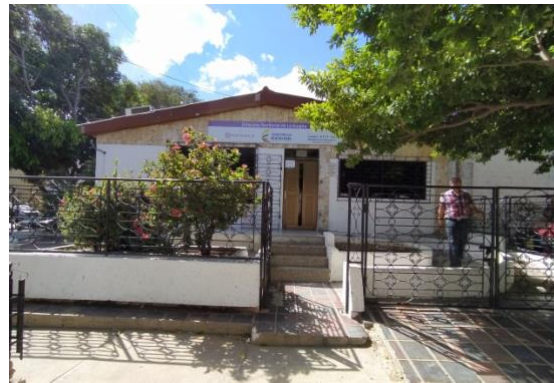
Vista actual del predio Riohacha