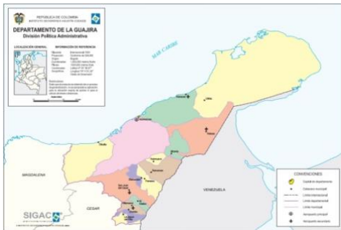
Mapa Departamento de la Guajira

La obra a ejecutar se encuentra en la sede territorial ubicada en Riohacha, departamento de La Guajira.