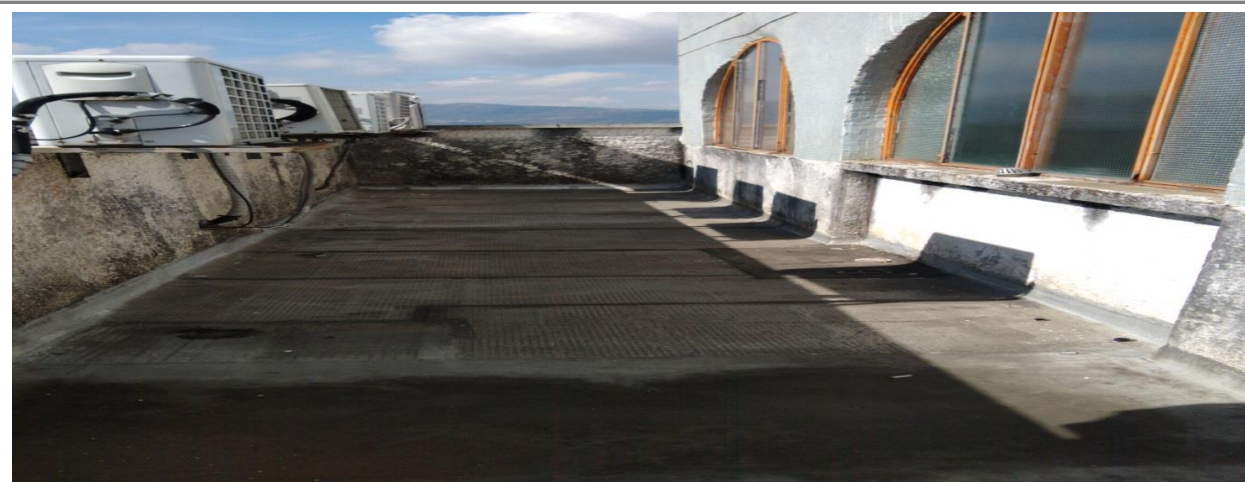
Fotografías al interior de la sede MINTRABAJO BUCARAMANGA