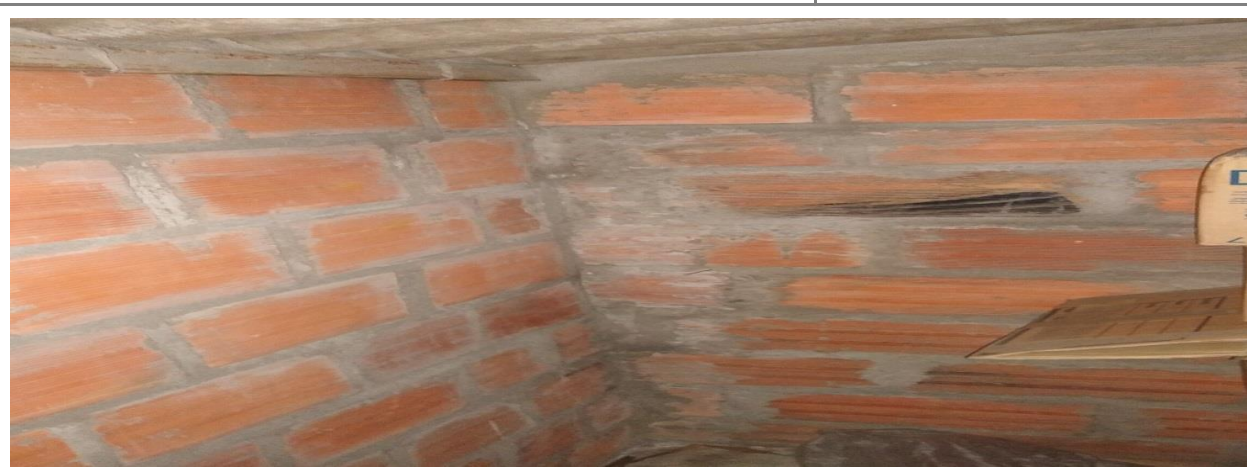
Fotografías al interior de la sede MINTRABAJO BUCARAMANGA