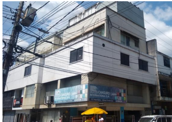
Fotografía 8. Vista actual del predio Bucaramanga

DIRECCION: CALLE 31 #13-71 Bucaramanga, Santander