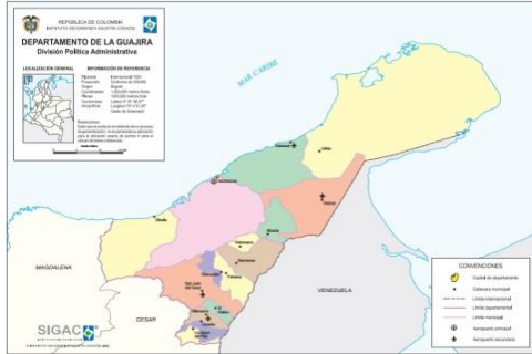
Mapa Departamento de la Guajira

Las obras a ejecutar se encuentran las sedes territoriales ubicadas en los departamentos de Córdoba y La Guajira, municipios Montería y Riohacha.