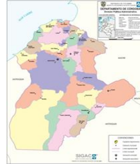
Mapa departamento de Córdoba