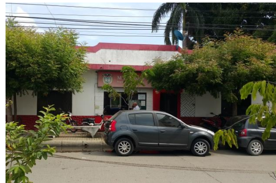
Fotografía 4. Vista actual del predio Montería (Córdoba)