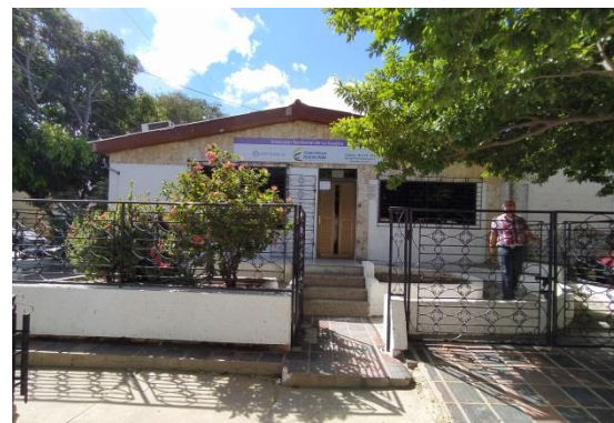
Fotografía 6. Vista actual del predio Riohacha

NOTA: CONOCIMIENTO DEL SITIO DEL PROYECTO: Será responsabilidad del proponente conocer las condiciones del sitio de ejecución del proyecto y actividades a ejecutar, para ello el proponente podrá hacer uso de los programas informáticos y las herramientas tecnológicas disponibles, teniendo como puntos de referencias las ubicaciones de los proyectos, la dirección de La Guajira es Cra. 10 # 14 – 102 en Riohacha y