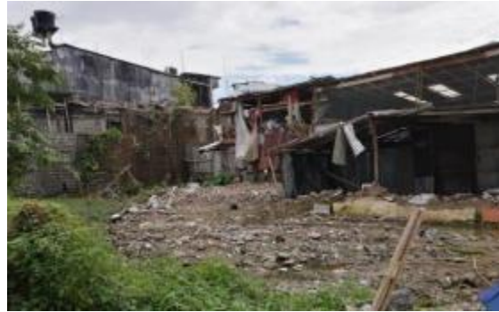
Vista actual del predio Quibdó / Calle 31 No. 9-26

PARÁGRAFO PRIMERO: Será responsabilidad del proponente conocer las condiciones del sitio de ejecución del proyecto y actividades a ejecutar, para ello el proponente podrá hacer uso de los programas informáticos y las herramientas tecnológicas disponibles, teniendo como puntos de referencia la ubicación del proyecto en la Calle 31 No. 9-26 en Quibdó – Chocó. En consecuencia, correrá por cuenta y riesgo de los proponentes, inspeccionar y examinar los lugares donde se proyecta realizar los trabajos, actividades, obras, los sitios aledaños y su entorno e informarse acerca de la naturaleza del terreno, la forma, características, accesibilidad del sitio, disponibilidad de canteras o zonas de préstamo, así como la facilidad de suministro de materiales e insumos generales. De igual forma, la ubicación geográfica del sitio del proyecto, historial de comportamiento meteorológico de la zona y demás factores que pueden