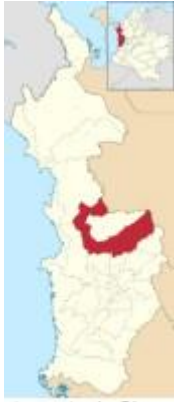
Departamento del Chocó