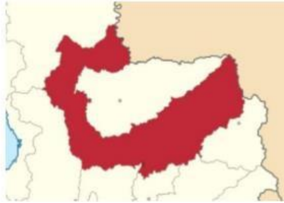
Municipio de Quibdó