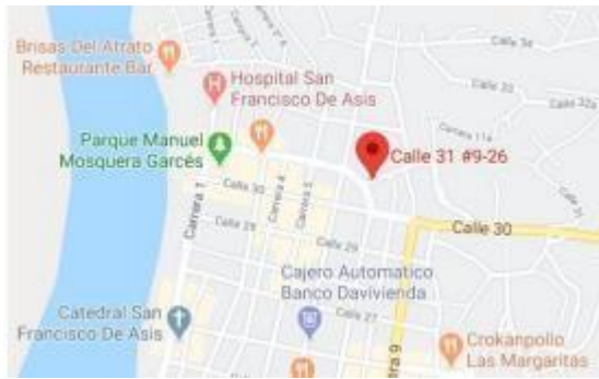
Localización proyecto Quibdó (Chocó) No. 9-26