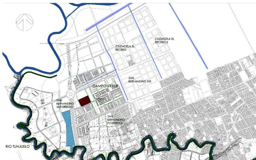
Figura 2 – Ubicación del predio donde se ejecutará el proyecto.

A su vez el predio donde se construirá el proyecto se encuentra limitado por el norte con la carrera 95, por el sur con la carrera 94, por el oriente con la futura calle 85 sur y por el occidente con la futura calle 86 sur como se muestra en la anterior imagen. La dirección exacta del lote es Calle 85 Sur # 94-35.