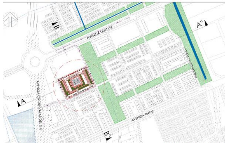
Figura 3. Ubicación general del inmueble, vías de acceso y elementos de referencia