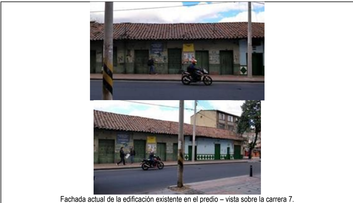
Fachada actual de la edificación existente en el predio – vista sobre la carrera 7.