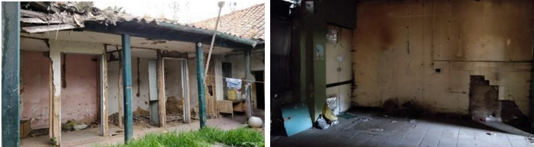
Estado actual de la edificación existente y establecida en los diseños su demolición y retiro