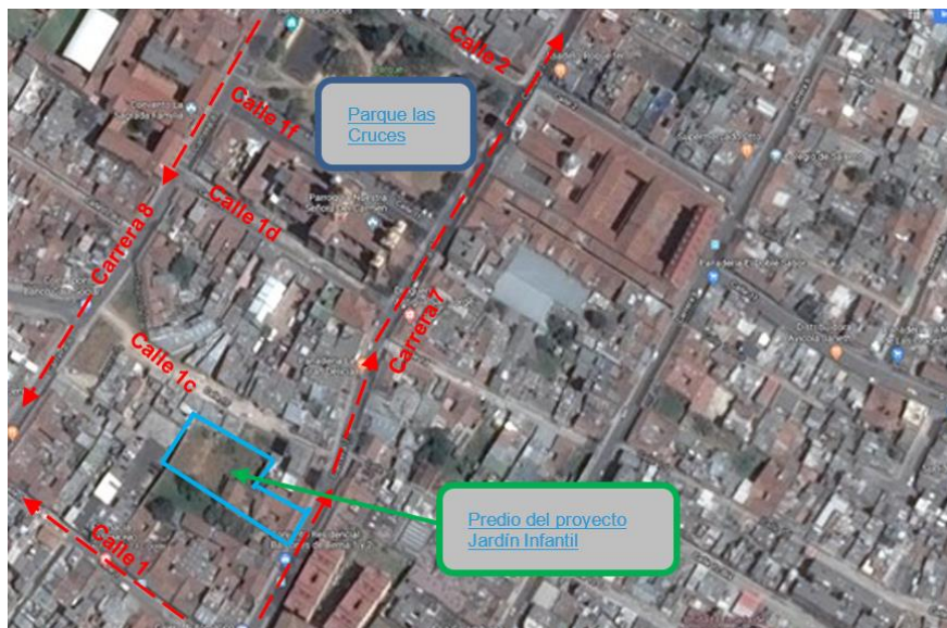
Figura 2. Ubicación general del inmueble, vías de acceso y elementos de referencia