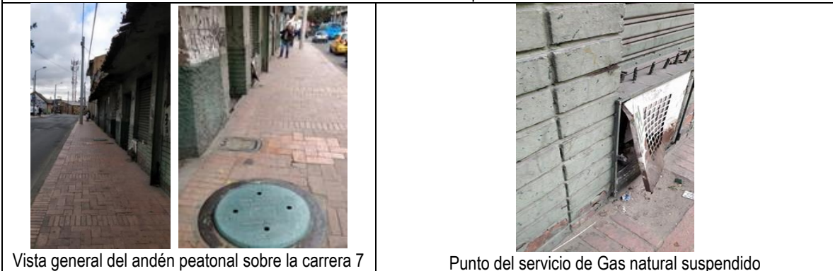
Vista general del andén peatonal sobre la carrera 7