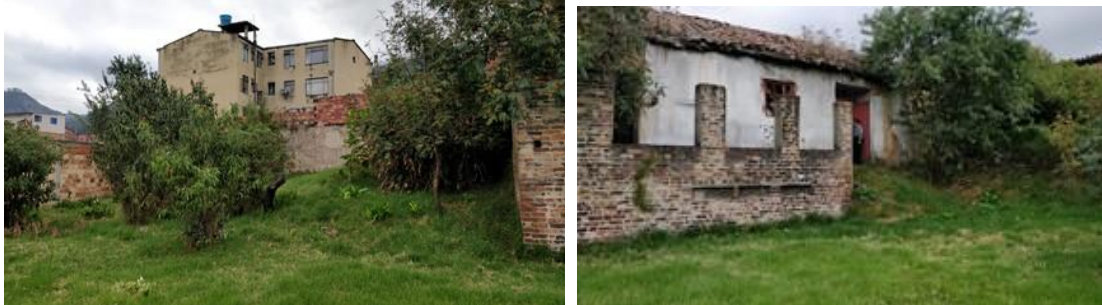
Vista del predio desde la parte posterior y hacia el oriente