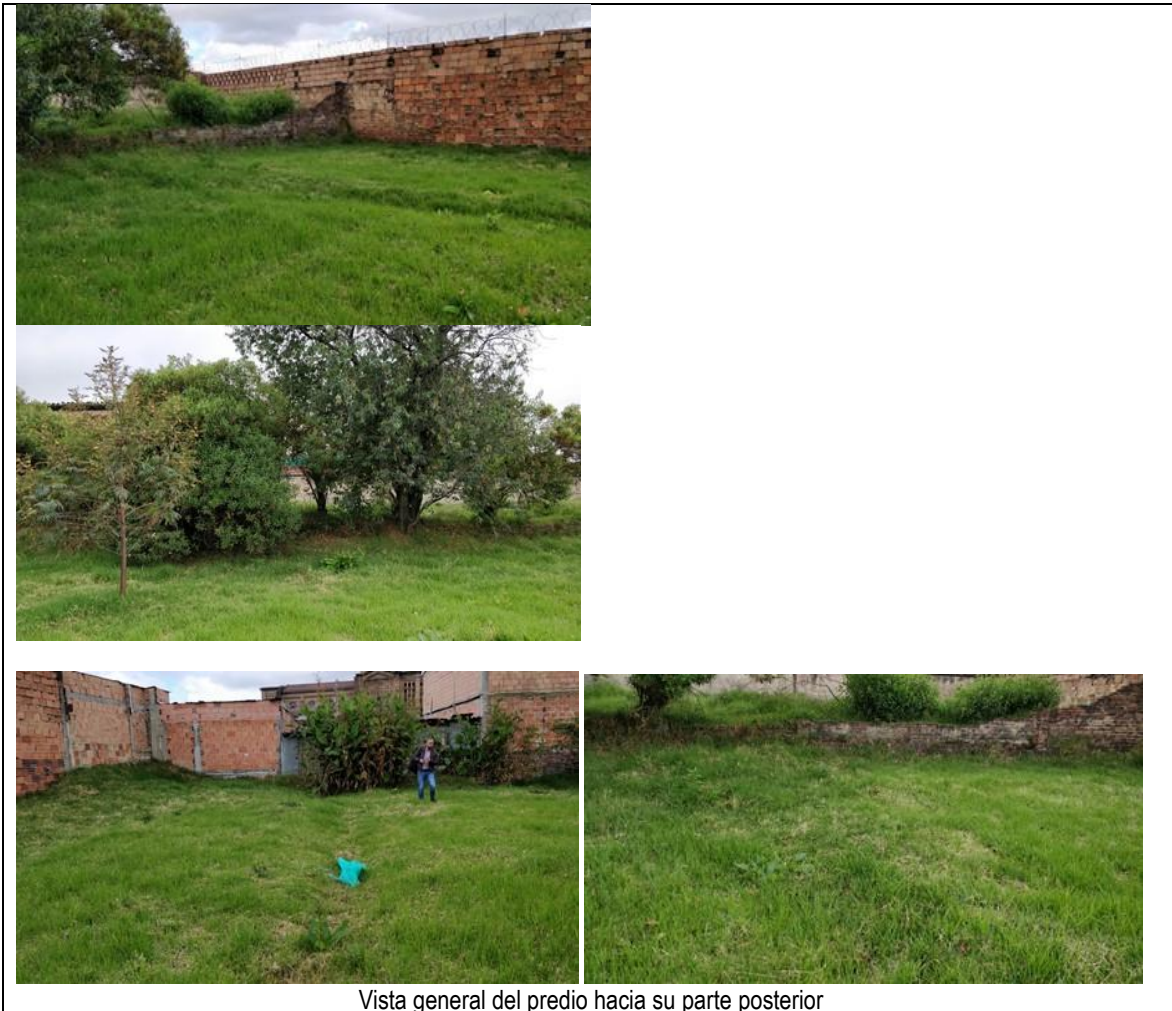
Vista general del predio hacia su parte posterior