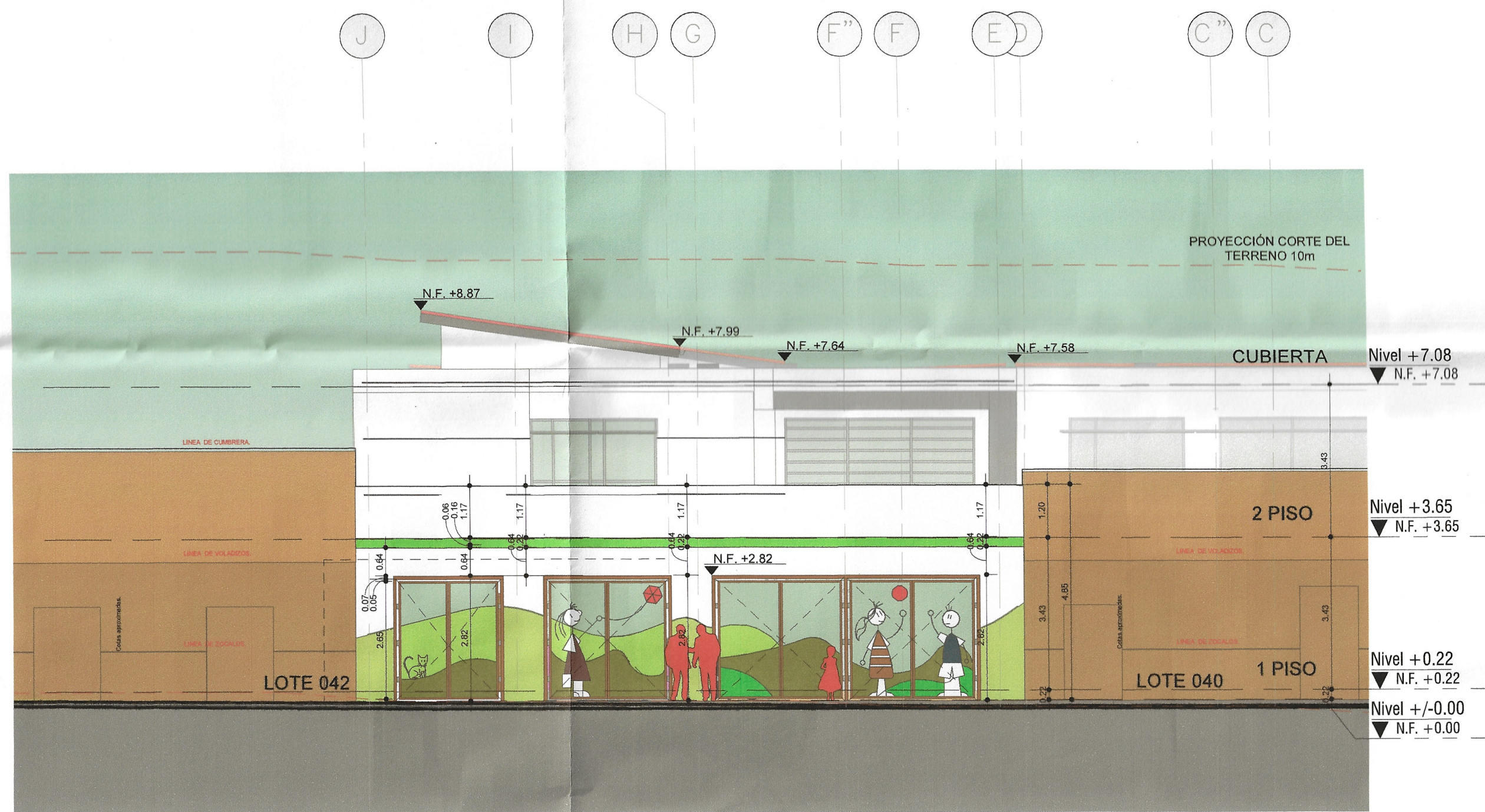
F1 Fachada Acceso 1:100