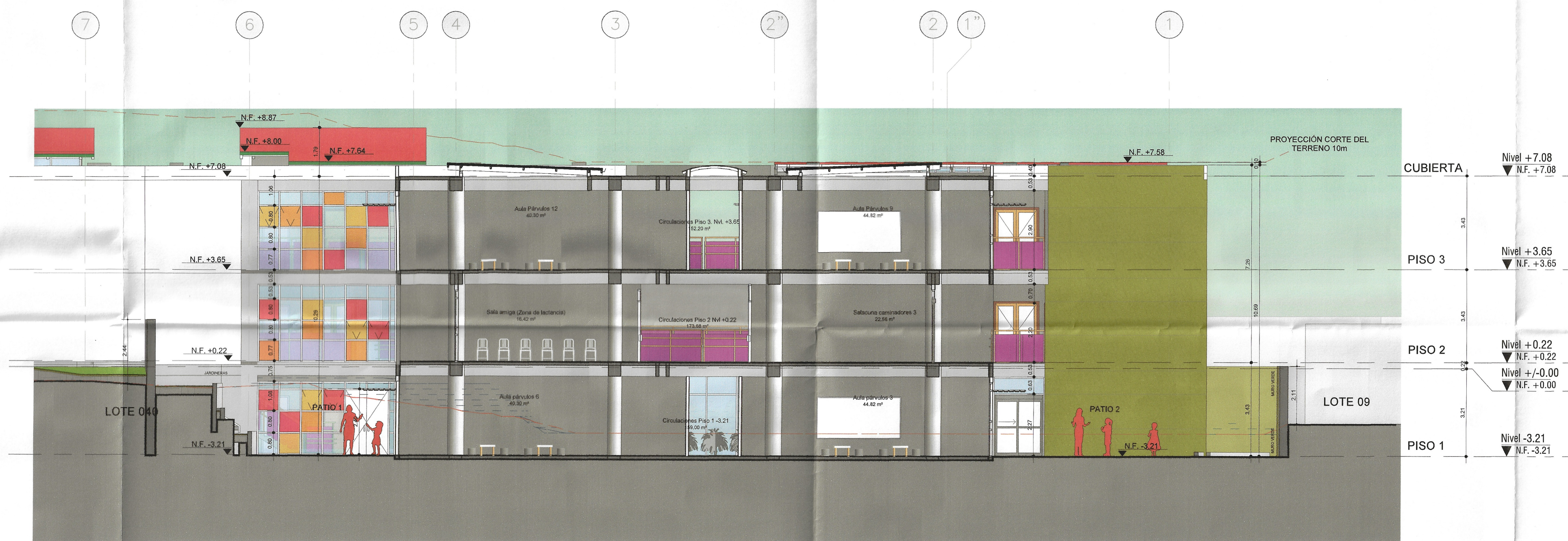
F3 Fachadas Patios 1:100