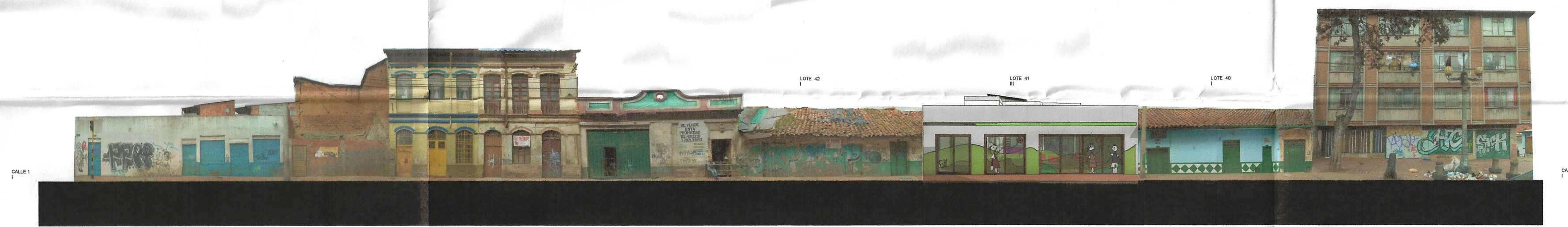
MONTAJE FACHADA DEL PROYECTO RESPECTO A LAS FACHADAS DE LA MANZANA.