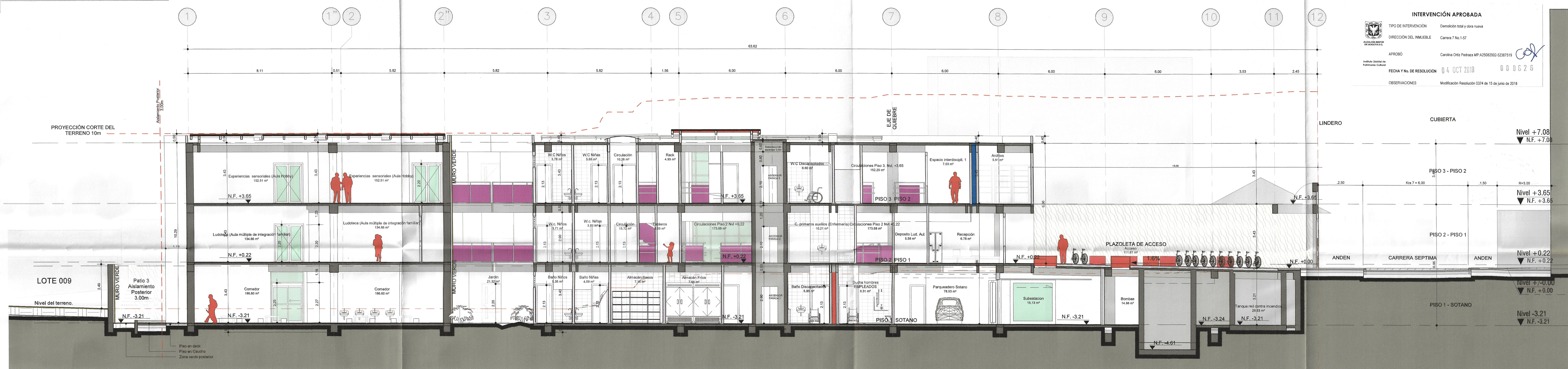
C3 Corte Longitudinal 3 1:100