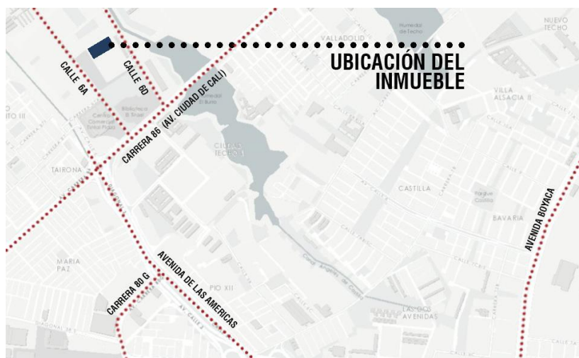
Imagen 3. Ubicación del Inmueble en la Localidad de Kennedy.