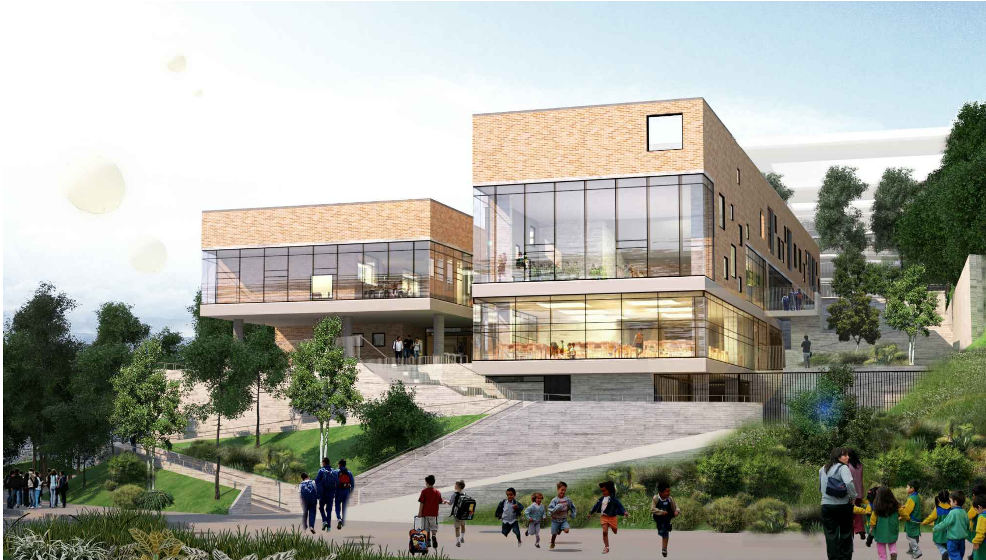
VISTA EXTERIOR ACCESO, FACHADA OCCIDENTAL