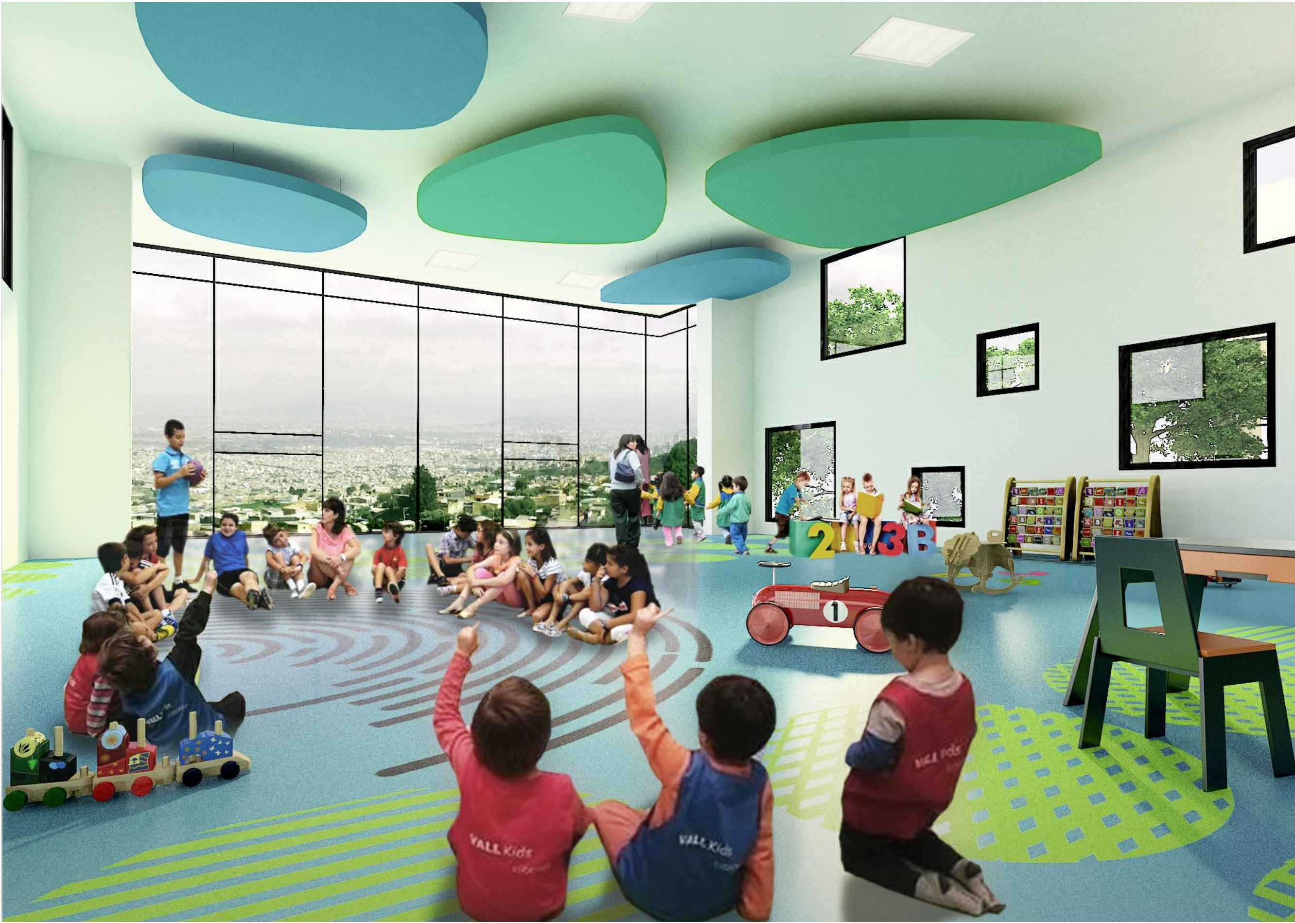
VISTA INTERIOR LUDOTECA