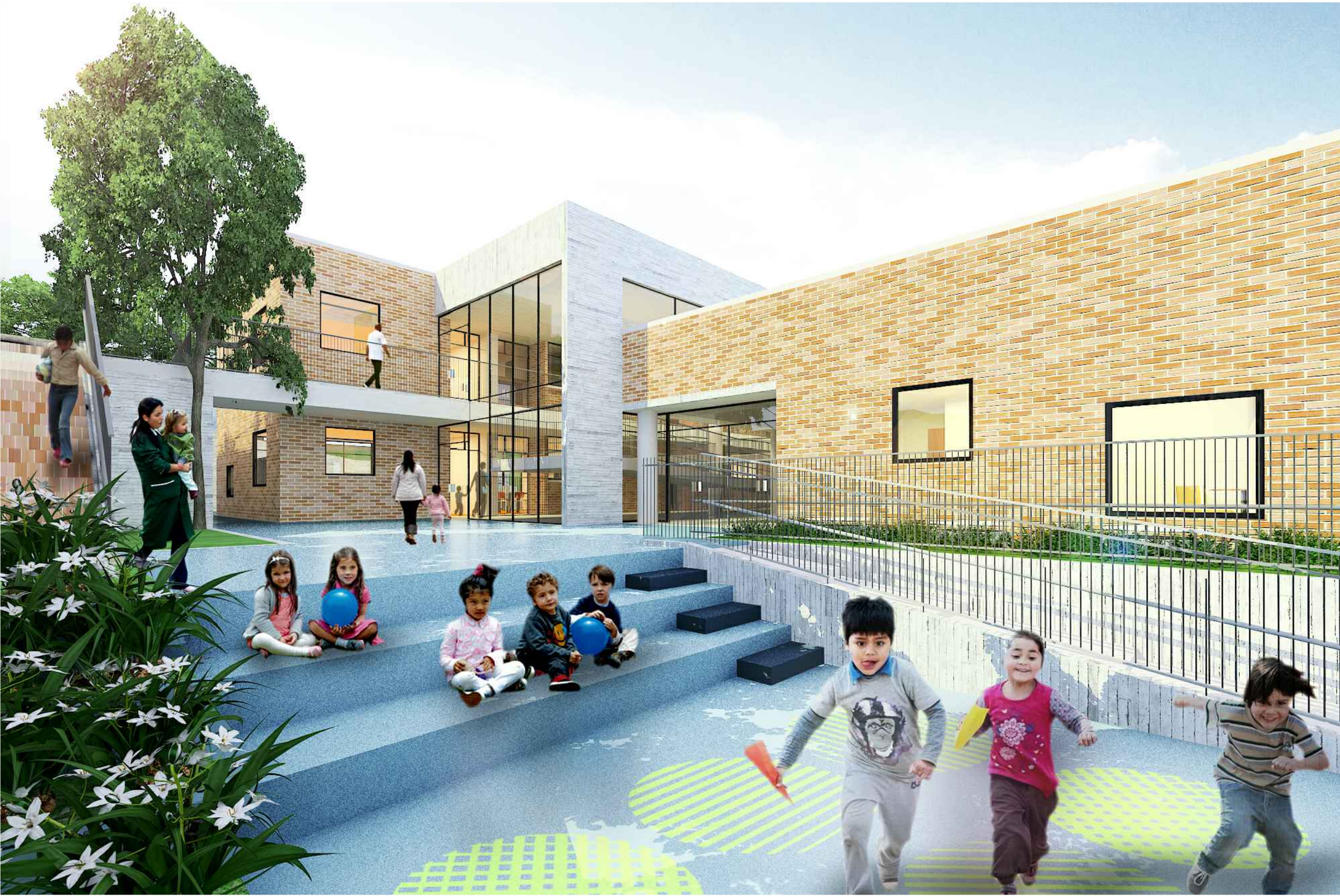
VISTA EXTERIOR TERRAZA