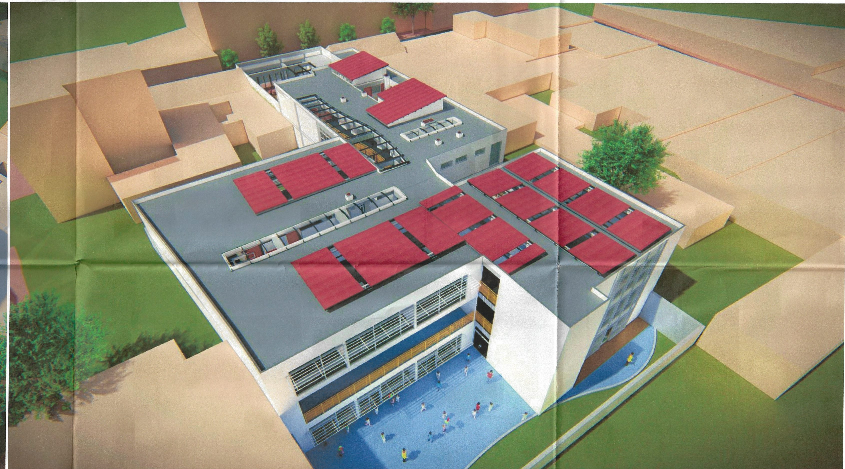
VISTA AEREA DESDE EL OCCIDENTE