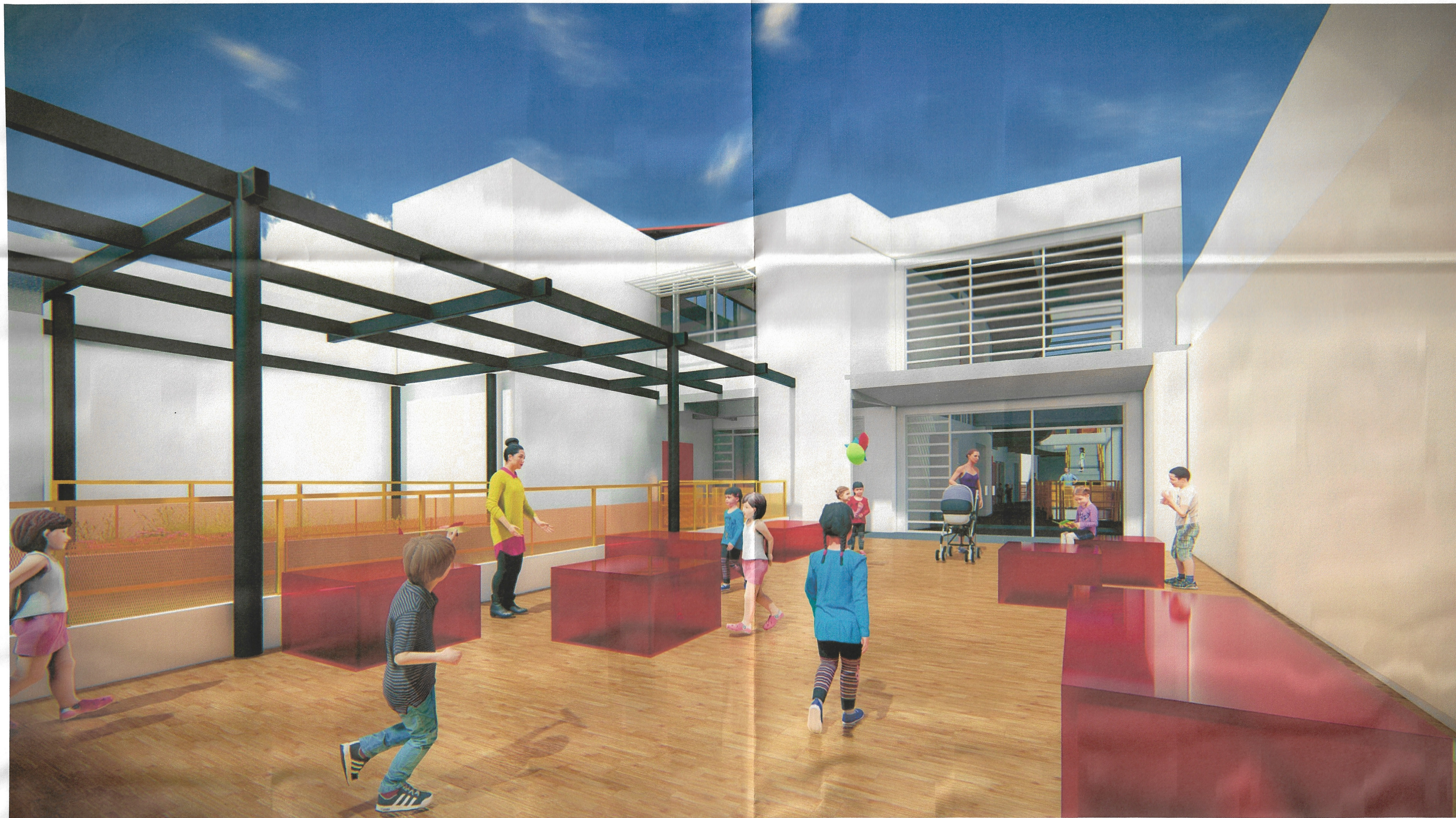
VISTA PLAZOLETA DE ACCESO