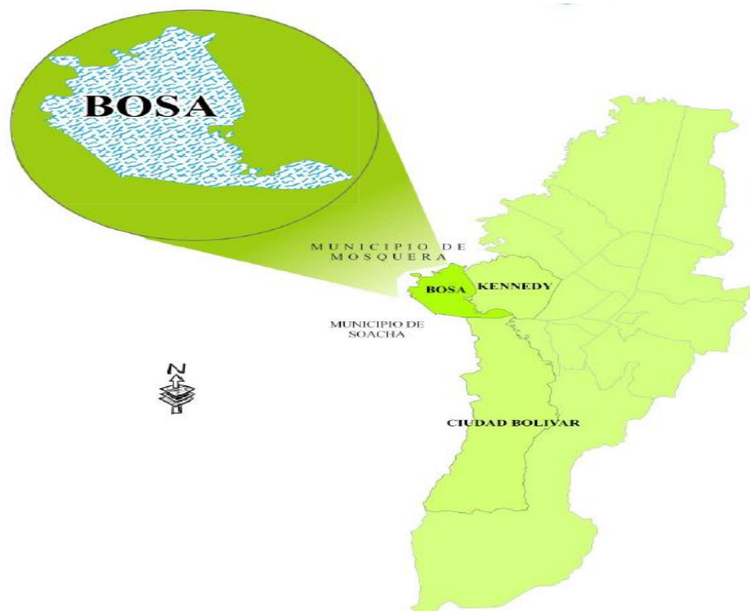
Figura 1 – Ubicación de la localidad de Bosa en la ciudad de Bogotá.