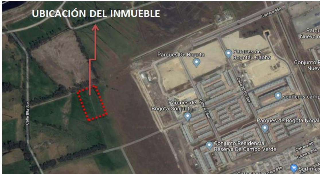
Figura 2. Ubicación general del inmueble, vías de acceso y elementos de referencia