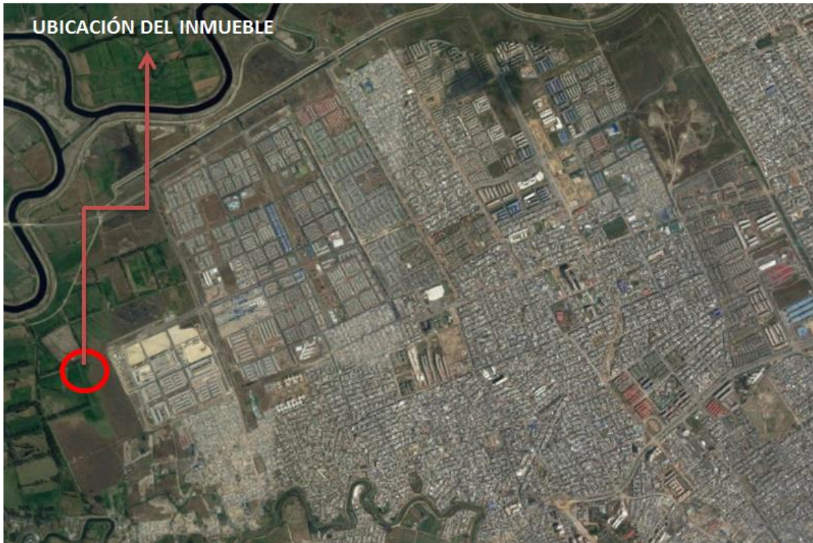
Ubicación del inmueble – UPZ 87 – Tintal Sur,

LOCALIZACIÓN DEL INMUEBLE EN LA LOCALIDAD DE BOSA