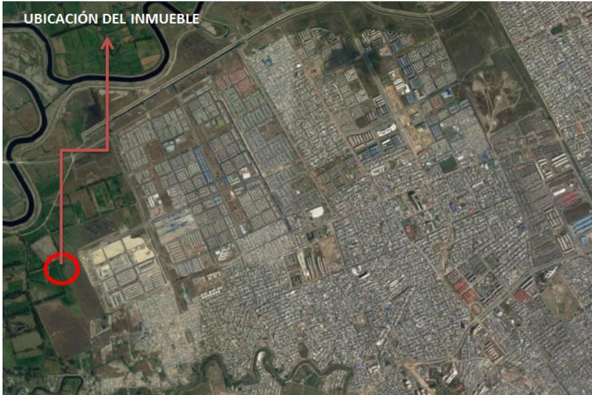
Ubicación del inmueble – UPZ 87 – Tintal Sur,