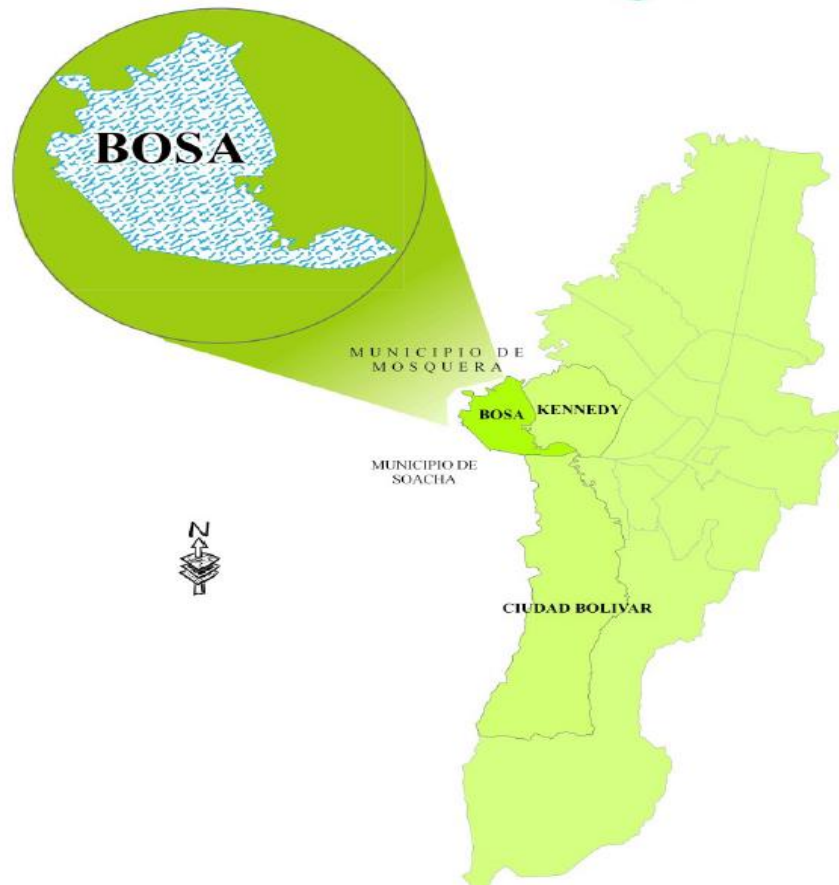
Figura 1 – Ubicación de la localidad de Bosa en la ciudad de Bogotá.

El área metropolitana de Bogotá es una conurbación colombiana no oficialmente constituida, por lo que su extensión exacta varía de acuerdo a la interpretación. De acuerdo con el Departamento Administrativo Nacional de Estadística (DANE), esta conurbación está compuesta por: Bogotá como su centro y (en orden alfabético) por los municipios de Bojacá, Cajicá, Chía, Cogua, Cota, El Rosal, La Punta Facatativá, Funza, Gachancipá, La Calera, Madrid, Mosquera, Nemocón, Soacha, Sibaté, Sopó, Subachoque, Tabio, Tenjo, Tocancipá y Zipaquirá. (Fuente: http://www.bogota.gov.co/ , consultado en Febrero 5 de 2018).