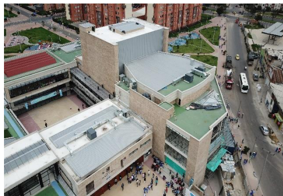
Vista Externa del Proyecto