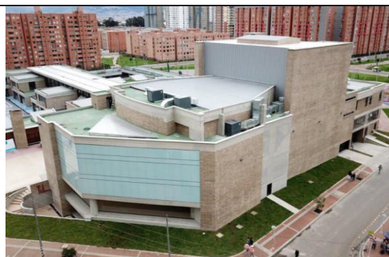
Vista Externa Proyecto