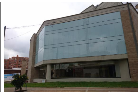
Vista Interna del Proyecto