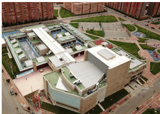
Vista Externa del Proyecto