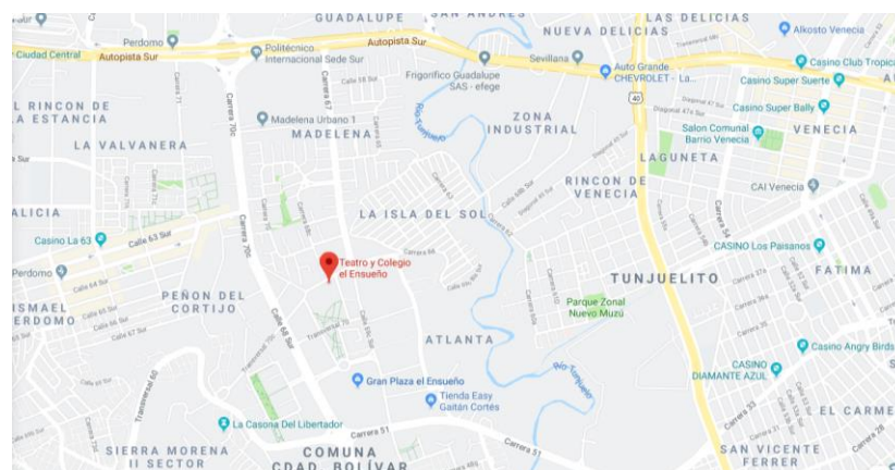
Figura 2 – Ubicación del predio donde se ejecutará el proyecto.