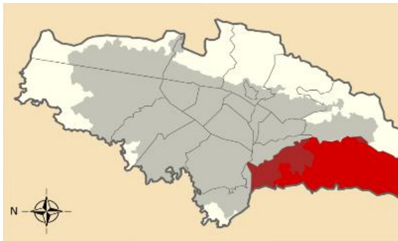
Figura 1 – Ubicación de la localidad de Ciudad Bolívar en la ciudad de Bogotá

Los predios donde se desarrollaran los proyectos definidos por la Secretaría Distrital de Cultura, Recreación y Deporte se encuentran ubicados en la localidad de Ciudad Bolívar (Localidad 19), en el entorno del Sistema de transporte masivo Transmicable.