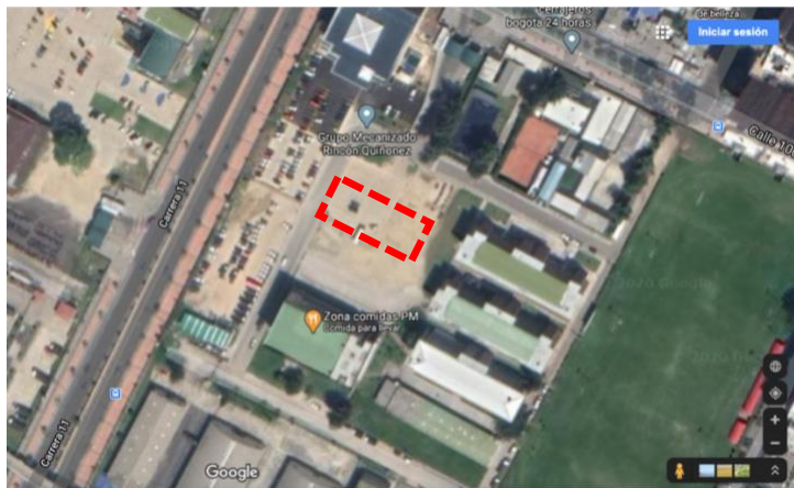
Fotografía 3. Localización Detallada del Nuevo Edificio del Comando de la Brigada XIII del Ejército.

NOTA: CONOCIMIENTO DEL SITIO DEL PROYECTO: Será responsabilidad del proponente conocer las condiciones del sitio de ejecución del proyecto y las diferentes actividades a ejecutar, para ello el proponente podrá hacer uso de los programas informáticos y las herramientas tecnológicas disponibles, teniendo como punto de referencia la ubicación del proyecto AK 7 N° 102 – 51, Bogotá D.C. En consecuencia, correrá por cuenta y riesgo de los interesados, inspeccionar y examinar los lugares donde se ejecutarán los proyectos, los sitios aledaños y su entorno, e informarse acerca de la naturaleza del terreno, la forma, características, accesibilidad del sitio, disponibilidad de canteras o zonas de préstamo, así como la facilidad de suministro de materiales e insumos generales. De igual forma, la ubicación geográfica del sitio del proyecto, historial de comportamiento meteorológico de la zona y demás factores que pueden incidir en la correcta ejecución del proyecto.