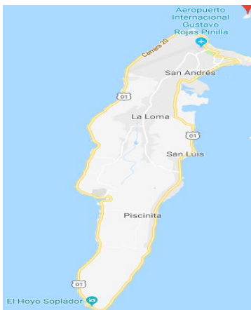
Figura 1 – 2 (Localización Municipio de San Andrés Isla en el Departamento del Archipiélago de San Andrés, Providencia y Santa Catalina – Colombia)