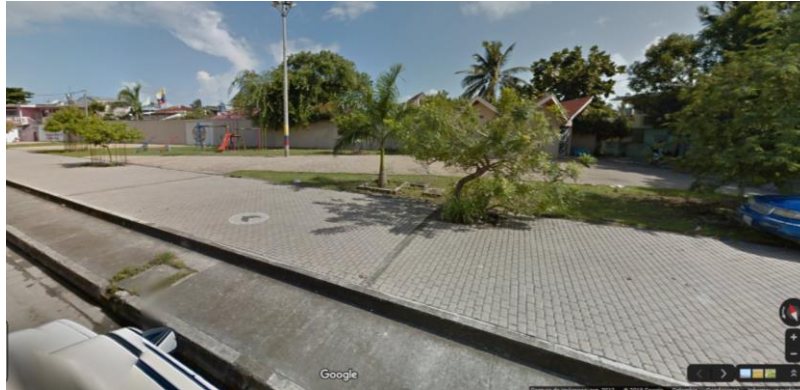
Fotografía 1. Predio donde se ejecutará el Proyecto

Ubicación del Lote: El lote en el cual se desarrollará el proyecto corresponde al predio con matrícula inmobiliaria No. 450-1389 y 450-10082 propiedad del municipio de Gobernación Departamento de San Andres, Providencia y Santa Catalina.