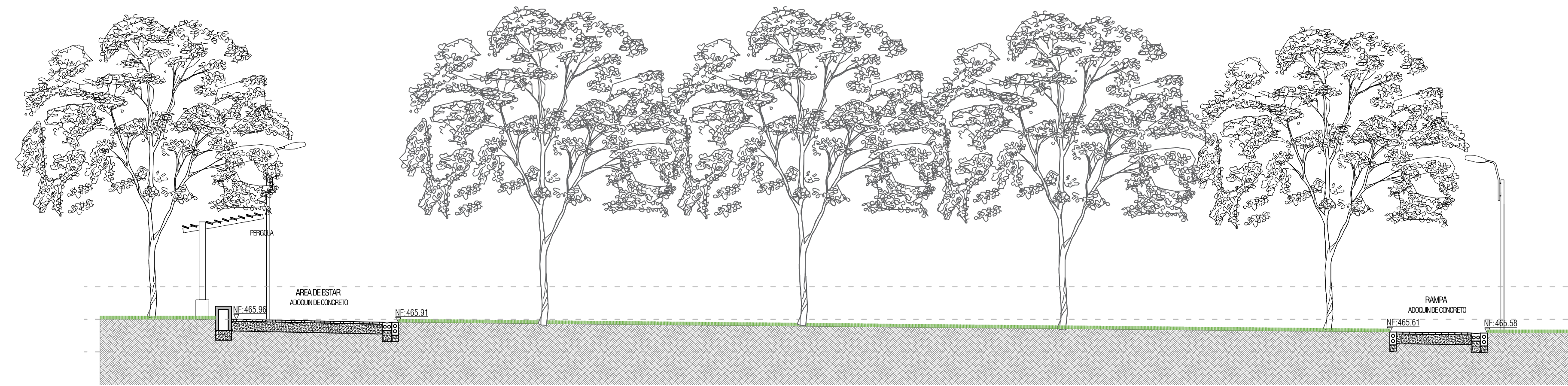
CORTE 2 Esc. 1:100