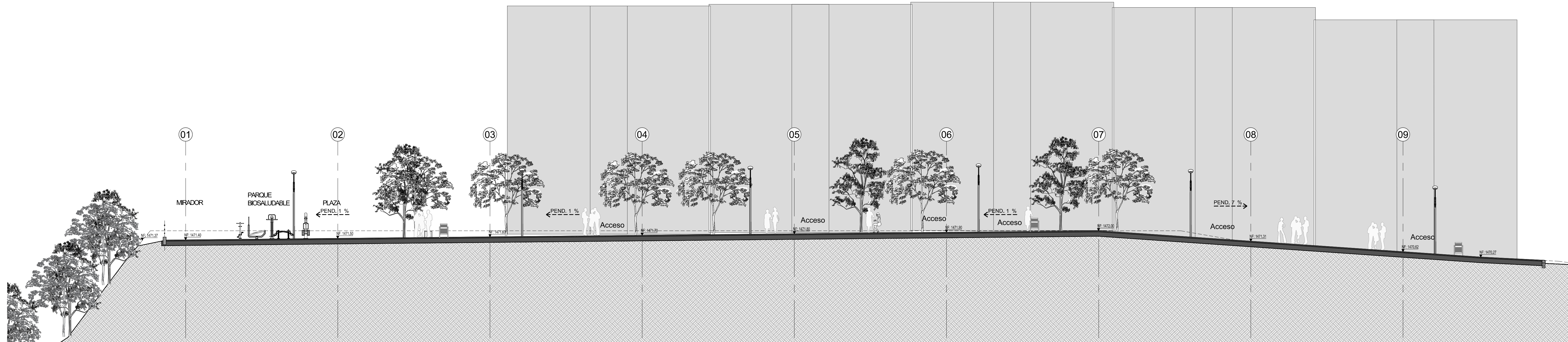
PLANTA PLAZOLETAS 1-1 Esc. 1:125