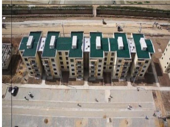
Figura 3. Ubicación del lote Urbanización Villas de San Pablo –Barranquilla, Atlántico