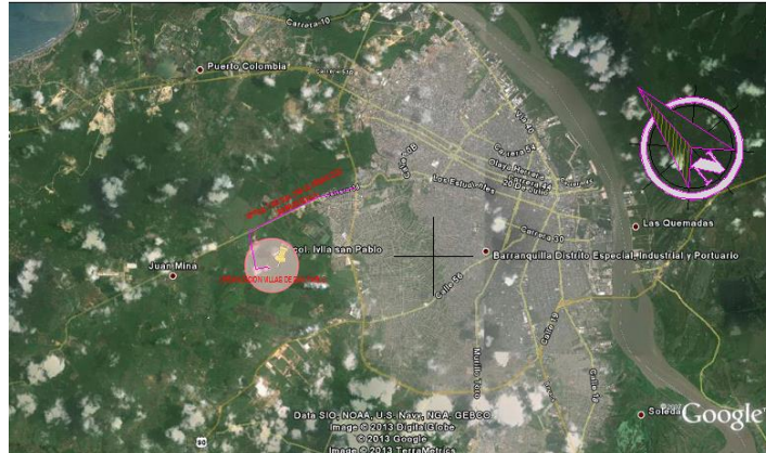
Figura 1. Localización Urbanización Villas de San Pablo –Barranquilla, Atlántico.

El colegio está enclavado dentro de la urbanización VILLAS DE SAN PABLO , dicha urbanización se encuentra en el corregimiento JUANMINA (Oriente de Barranquilla), y está a una distancia de 7 Km del casco urbano de la ciudad de Barranquilla.