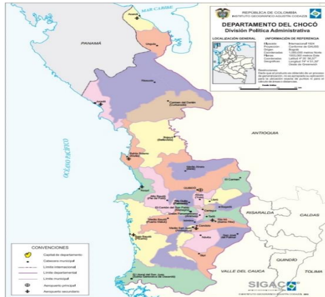
Figura 1. Departamento de chocó

Las obras a ejecutar se encuentran localizadas en el área rural del PACIFICO y en el departamento de ANTIOQUIA: