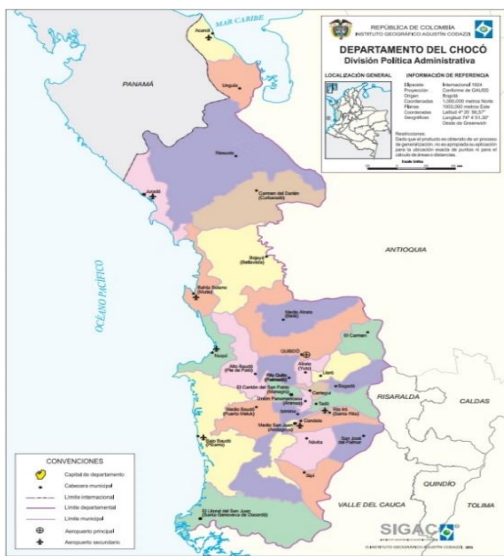
Figura 1. Departamento de Chocó

Las obras a ejecutar se encuentran localizadas en el área rural del PACIFICO y en el departamento de ANTIOQUIA: