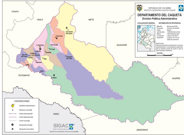
Figura 1 – Ubicación del Departamento de Cauquetá

Las obras a ejecutar se encuentran localizadas en el área rural del SUR ORIENTE del país: