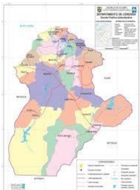
Figura 2 – Ubicación del Departamento de Córdoba