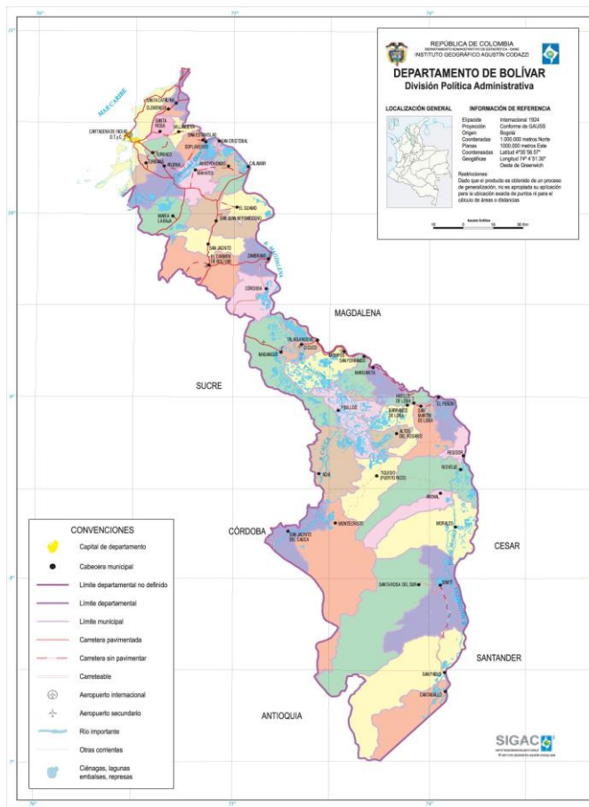
Figura 1 – Ubicación del Departamento de Bolívar