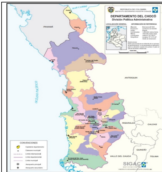
Figura 1. Departamento de Chocó

Las obras a ejecutar se encuentran localizadas en el área rural de los departamentos de CHOCÓ, PUTUMAYO y NARIÑO: