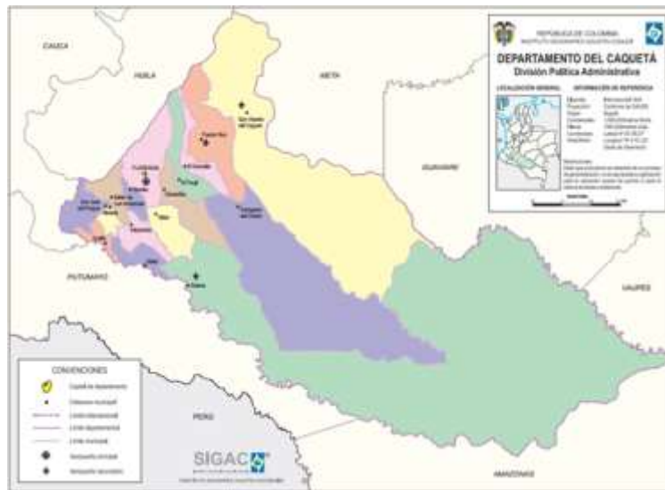
Figura 1 – Ubicación del Departamento de Caquetá

Las obras a ejecutar se encuentran localizadas en el área rural del sur oriente del país: