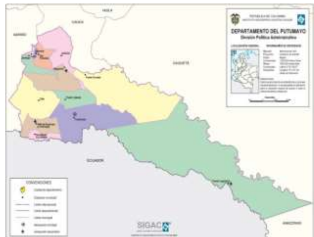
Figura 3 – Ubicación del Departamento de Putumayo

En los diagnósticos efectuados por FINDETER, se puede observar la localización específica de cada sede, el respectivo Registro Fotográfico de cada uno de los predios y el estado actual de su infraestructura.