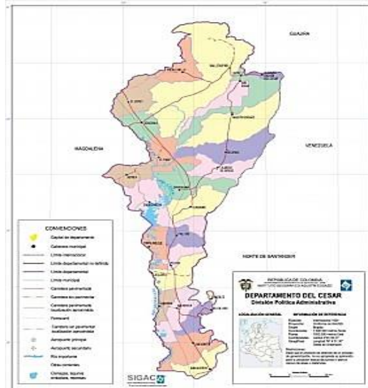
Figura 3 – Ubicación del departamento de Cesar