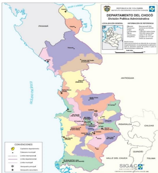
Figura 1. Departamento de chocó

Las obras a ejecutar se encuentran localizadas en el área rural del PACIFICO y en el departamento de ANTIOQUIA: