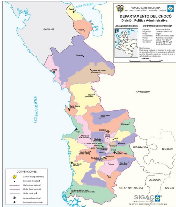
Figura 1 – Ubicación del Departamento de Chocó