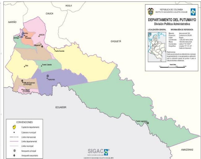
Figura 3 – Ubicación del Departamento de Putumayo